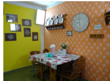
velká kulturní místnost