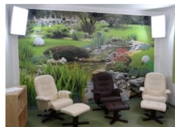
místnost pro Světelnou terapii