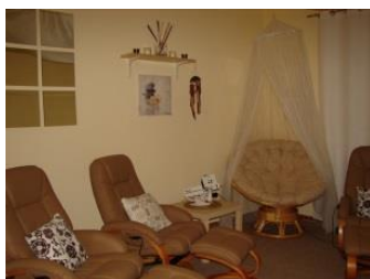
relaxační místnost Snoezelen