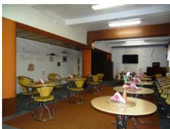
velká kulturní místnost

Kromě společenských prostorů na jednotlivých pavilonech mohou uživatelé využívat velkou kulturní místnost a terapeutickou místnost určenou pro všechny uživatele domova, která se nachází v suterénu pavilonu P2. Tato místnost zároveň slouží jako místo pro aktivizační činnosti pro uživatele. K aktivizačním činnostem dále mohou uživatelé využívat relaxační místnost Snoezelen , dílnu pro ruční práce na pavilonu P1 nebo místnost pro světelnou terapii na pavilonu P2.